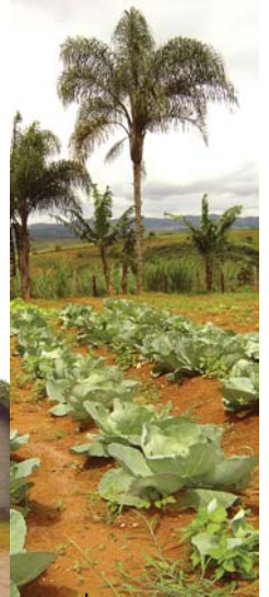
Fazenda (unidade 2), em Conselheiro Lafaiete (MG).