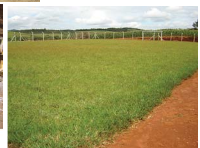
Abaixo: campo de futebol (unidade 2).