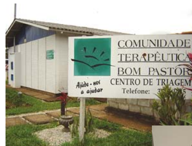
Sede da Comunidade Terapêutica Bom Pastor, no bairro Pioneiros, em Ouro Branco (MG). Aqui funciona o Centro de Triagem (unidade 1).

A Nunes tem orgulho de poder participar da CTBP, que tem atingido um índice de recuperação de dependentes acima da média mundial. O site da CTBP é www.ctbompastor.org.br . Contatos também pelo telefone 31 3742-1445.